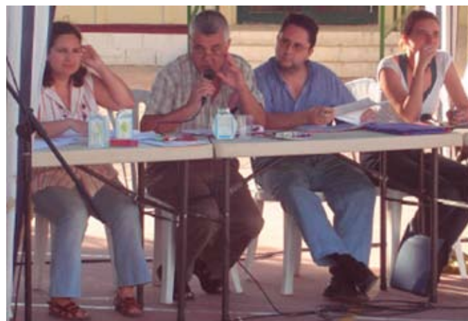
Imagen 5. Miembros de un grupo motor coordinan una asamblea de los presupuestos participativos de Sevilla.

Los grupos motores reúnen, por barrios o temáticas afines, a personas voluntarias que colaboran en la difusión y desarrollo del proceso en sus territorios o sectores. El número de sus miembros es variable, generalmente reducido, mantienen reuniones periódicas y se fundamentan en distintos compromisos militantes. Realizan su trabajo —difundir el proceso, convocar actos, preparar y coordinar las asambleas...— en estrecho contacto con los técnicos municipales de animación sociocultural, la dirección de sus centros cívicos de referencia y los técnicos de los presupuestos participativos.