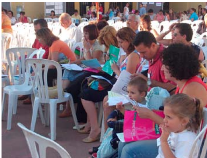
Imagen 4. Asistentes a una asamblea de los presupuestos participativos en un barrio de Sevilla.

En la ronda de asambleas para la defensa y votación de las propuestas ciudadanas, son también elegidas delegadas y delegados que configuran los otros dos órganos ciudadanos del proceso: los consejos de distrito y el Consejo de ciudad. Esta representación debe ser paritaria (igual número de hombres que de mujeres), anual y revocable. Los consejos recogen y ordenan, en su ámbito, las propuestas vecinales de acuerdo con los criterios establecidos en el Autorreglamento y las entregan a las autoridades del distrito o delegación municipal a que van dirigidas. Transcurrido el período de un año, son elegidos nuevos consejos de distrito y de ciudad y las anteriores delegadas y delegados pasan a constituir comisiones de seguimiento —por distritos y delegaciones o grupo de delegaciones municipales— encargadas de supervisar la ejecución de las propuestas vecinales. Además de las comisiones de seguimiento, existen otros dos grupos de trabajo ciudadanos: la Comisión de Autorreglamento —constituida por delegadas y delegados y por técnicos del presupuesto participativo para elaborar el texto a debatir y votar en las asambleas— y los grupos motores.