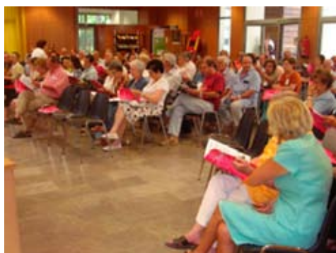
Imagen 8-9-10. Presupuestos participativos de Sevilla. Votación de propuestas y entrega al Gobierno local. Al finalizar la asamblea ciudadana las propuestas son votadas. Las propuestas más votadas y puntuadas son entregadas al Gobierno local que las recepciona considerándolas vinculantes.

El Ayuntamiento las recepciona, ante representantes de los presupuestos participativos y otros vecinos y vecinas, bajo la aceptación pública de su carácter vinculante y, hasta agotar las partidas destinadas a los presupuestos participativos, son incorporadas al Presupuesto Municipal del siguiente ejercicio.