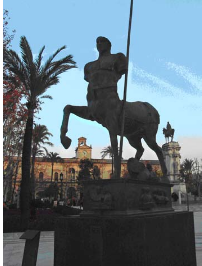
Imagen 01: Poder local. “Centauro”, de Igor Mitoraj, expuesta en Plaza Nueva de Sevilla, próxima a la estatua ecuestre del rey San Fernando. Al fondo, fachada principal del Ayuntamiento.

El candidato del Partido Socialista Obrero Español, Alfredo Sánchez Monteseirín, volvería a ser alcalde de Sevilla con los votos favorables de los concejales de Izquierda Unida. El grupo municipal socialista desempeñaría la máxima responsabilidad en la mayor parte de las estructuras municipales y, a cambio, IU obtendría importantes parcelas de dirección política: el Instituto Municipal de Deportes, las delegaciones de Participación Ciudadana, de Empleo y de Juventud, el Distrito Sur, una cuota en la alta dirección de la Gerencia Municipal de Urbanismo y cierta presencia en las empresas municipales. El “reparto de poder” quedó, no sin controversias, a satisfacción de las partes y fue acompañado de un documento programático: el Pacto de Progreso por Sevilla. Este pacto, cuyo texto obedece al objetivo de constituir “un gobierno progresista para Sevilla”, incluyó, entre otros contenidos, la apertura de un proceso