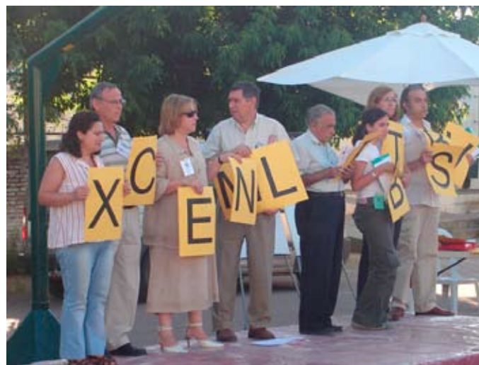
Imagen 6-7. Presupuestos participativos de Sevilla. Presentación, defensa y votación de propuestas.

Las propuestas presentadas son defendidas y sometidas a votación en las asambleas de zona.